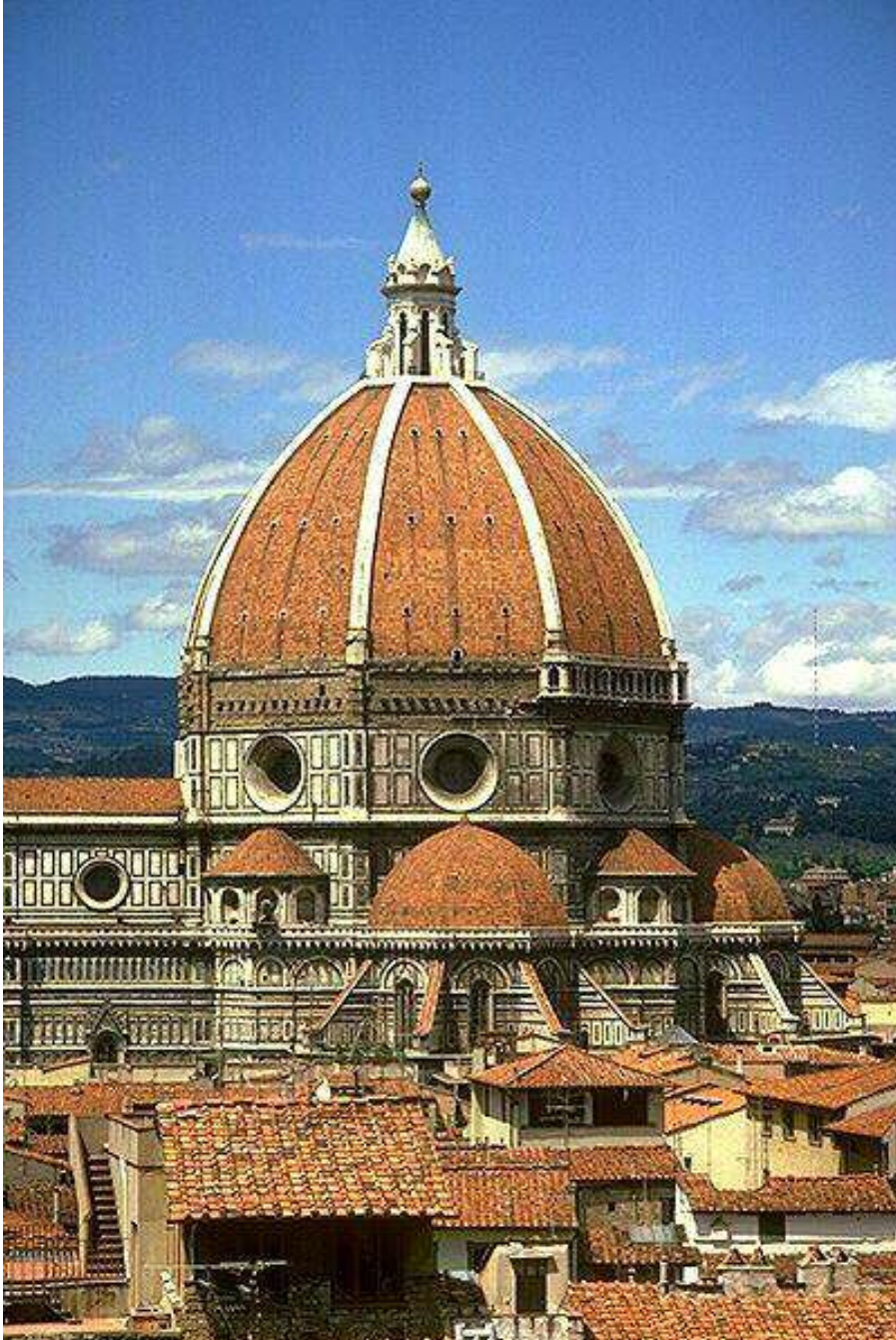
کاتیدرالی فلۆرېنس، ئىتالیا Florence Cathedral